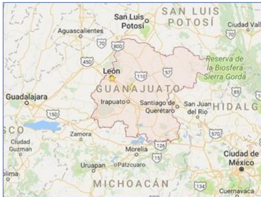
Mapa 1. Ubicación Geográfica de Guanajuato

Guanajuato, junto con los estados de Querétaro, Jalisco, Michoacán de Ocampo y San Luis Potosí conforman el Bajío Mexicano, región de gran riqueza climática, cultural y económica. El clima es seco y semiseco, principalmente, con una temperatura media anual de 18 grados centígrados, y una precipitación total anual de 650 mm 3 .