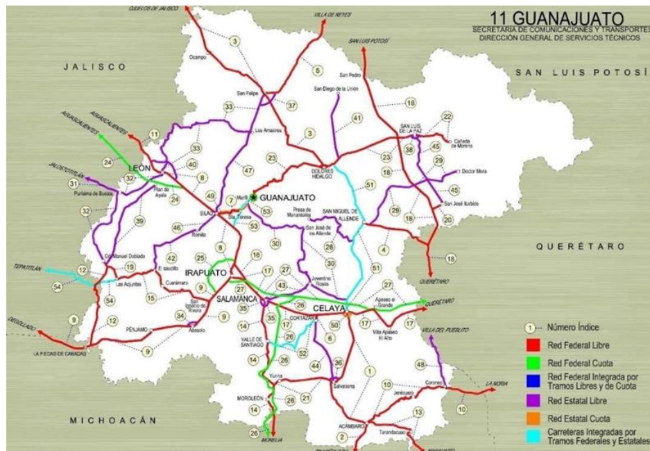
Mapa 3. Infraestructura Carretera de Guanajuato

De acuerdo con el Anuario estadístico y geográfico por entidad federativa 2015, el estado de Guanajuato contaba en 2014 con una longitud carretera de 12,820 km, 1,085 km de vías férreas, un aeropuerto nacional, 1 aeropuerto internacional y 10 aeródromos.